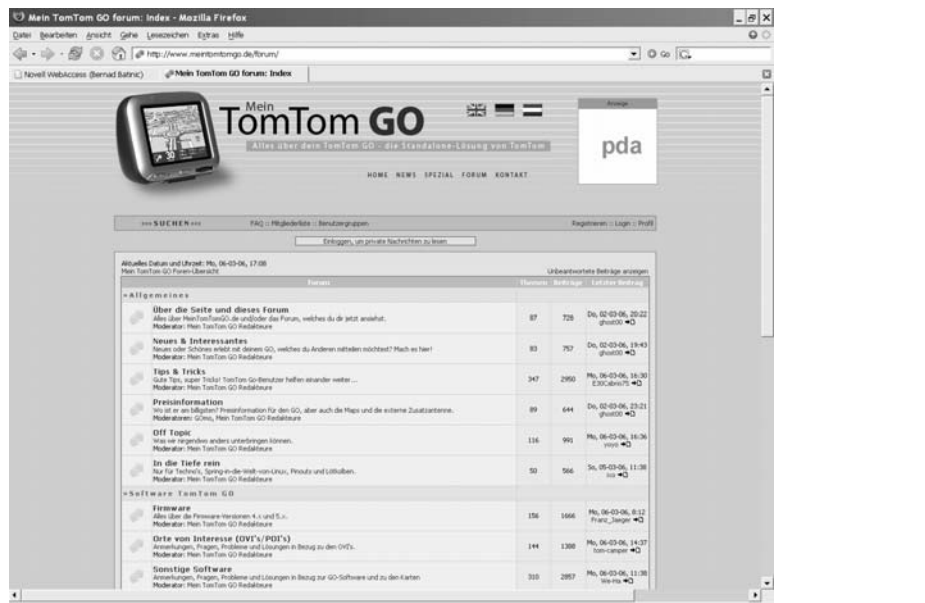
Abbildung 3-1: Diskussionsforum zum Navigationssystem TomTom